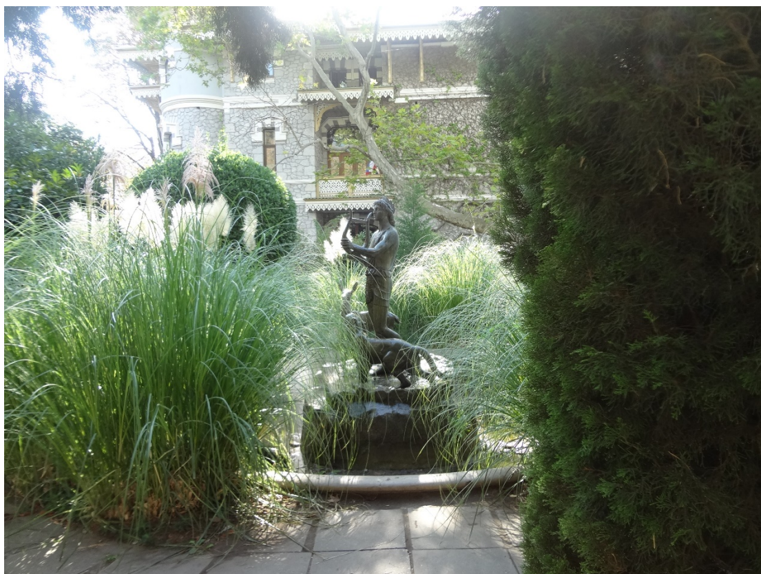
А Русалка просматривалась сквозь листву: у нее в поднятых над головой руках был кувшин – прекрасная девушка – скульптура с фонтана «Рахиль».